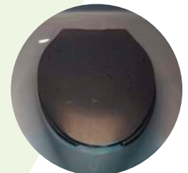
W.C. con tapa y asiento