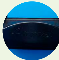
Porta papel higiénico