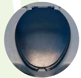
W.C. con tapa y asiento